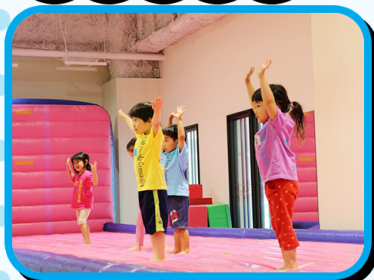
エアートランポリンで安全に、楽しく、無理なく様々な技に挑戦できます