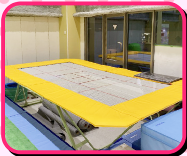
トランポリンは空中感覚や体幹、バランス能力を養えます