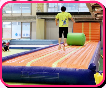
アクロバットも自由自在に練習できる14mのエアートランポリン