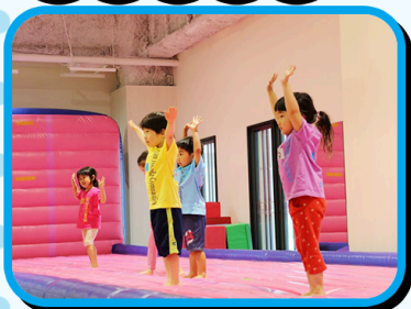
エアートランポリンで安全に、楽しく、無理なく様々な技に挑戦できます