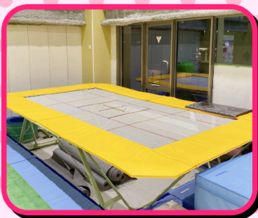
トランポリンは空中感覚や体幹、バランス能力を養えます